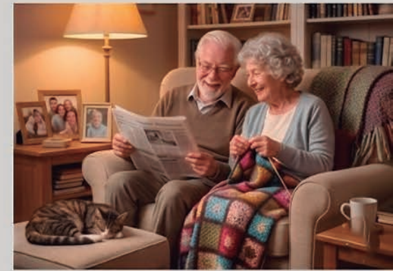
Diets poco Equilibradas